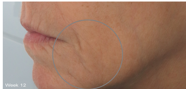
Afbeeldingen gemaakt en geanalyseerd met behulp van het Clarity 2D Research System