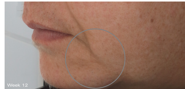
Afbeeldingen gemaakt en geanalyseerd met behulp van het Clarity 2D Research System

PROTOCOL: Een onafhankelijk klinisch onderzoek van 24 weken met 45 deelnemers naar de effectiviteit van Firming Serum. De deelnemers waren vrouwen in de leeftijd van 40 tot 69 jaar met Fitzpatrick huidtypen II-IV. Tijdens het onderzoek werd Firming Serum aangevuld met Gentle Cleanser en Sunscreen + Primer Broad-Spectrum SPF 30.